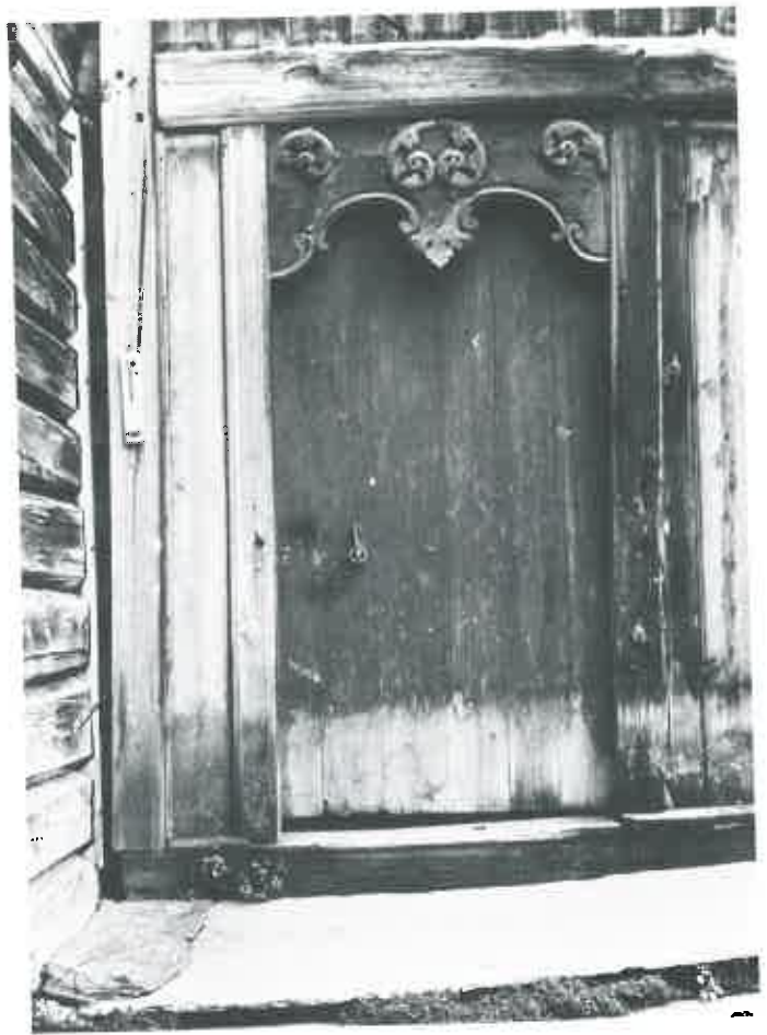
Gudbrandsdalen er kjent for sine dyktige treskjærere. Denne svaldøra viser at det både fantes flinke kunstnere, og at det var et marked for arbeidene deres.

Til det veggfaste inventaret i stua hørte også ei seng hvor ektefolkene hadde sin soveplass. Senga var alltid plassert i et hjørne og hadde dermed ei «langside» ut mot rommet. Også her finner en samme utsmykkings-