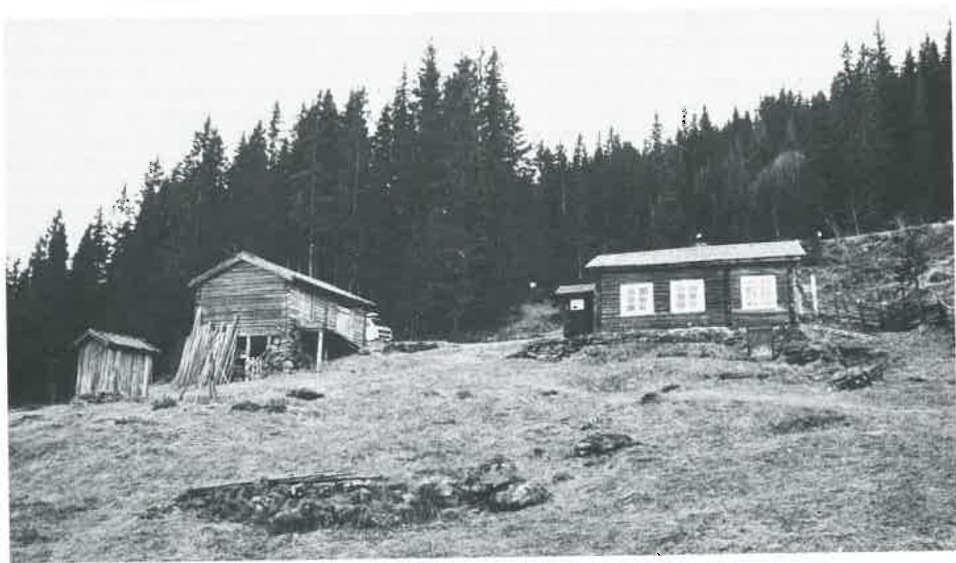
Plassen Stykkebakken fra Nedre Bø i Vestre Gausdal. Stua, låven og utedoen er flyttet til Maihaugen og gjenreist i skogen ovenfor Øygarden. Fjøsset var revet, men samlingene fikk overta et lignende fjøs på nabobruket Bjerkli.

og politisk kamp for å få opphevet systemet. Utflytting til byene og til Amerika i siste halvpart av forrige århundre lettet på presset og medvirket til at husmannsvesenet gradvis ble borte. De plassene som ikke ble fraflyttet og nedlagt, ble etter hvert kjøpt av husmennene og gikk over til å bli selveiende bruk.